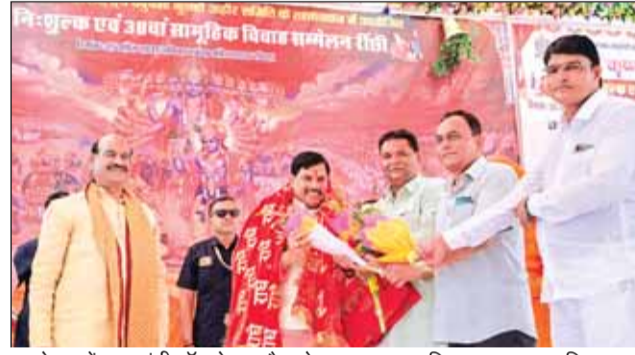
आयोजन में मुख्यमंत्री डॉ. मोहन और लोकसभा अध्यक्ष बिरला का स्वागत किया गया