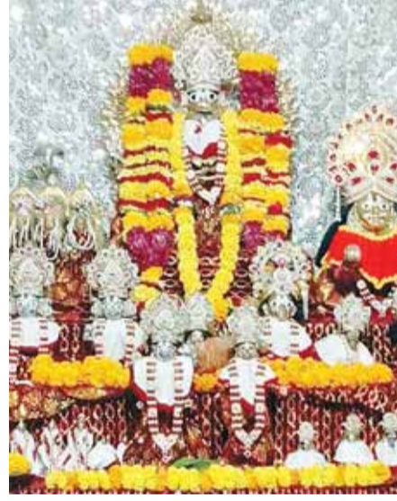
परिवार, सनातन धर्म महासभा जबलपुर ने किया है।